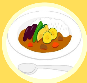
1日目夜 〈夏野菜カレー〉