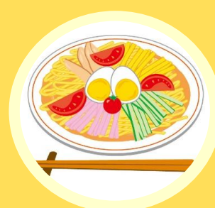
2日目昼 〈冷やし中華〉